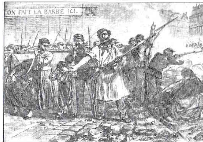
Comuna din Paris, 1871: „On fait la barbe ici.”

Protest anti-vaccinare, București, 2021: